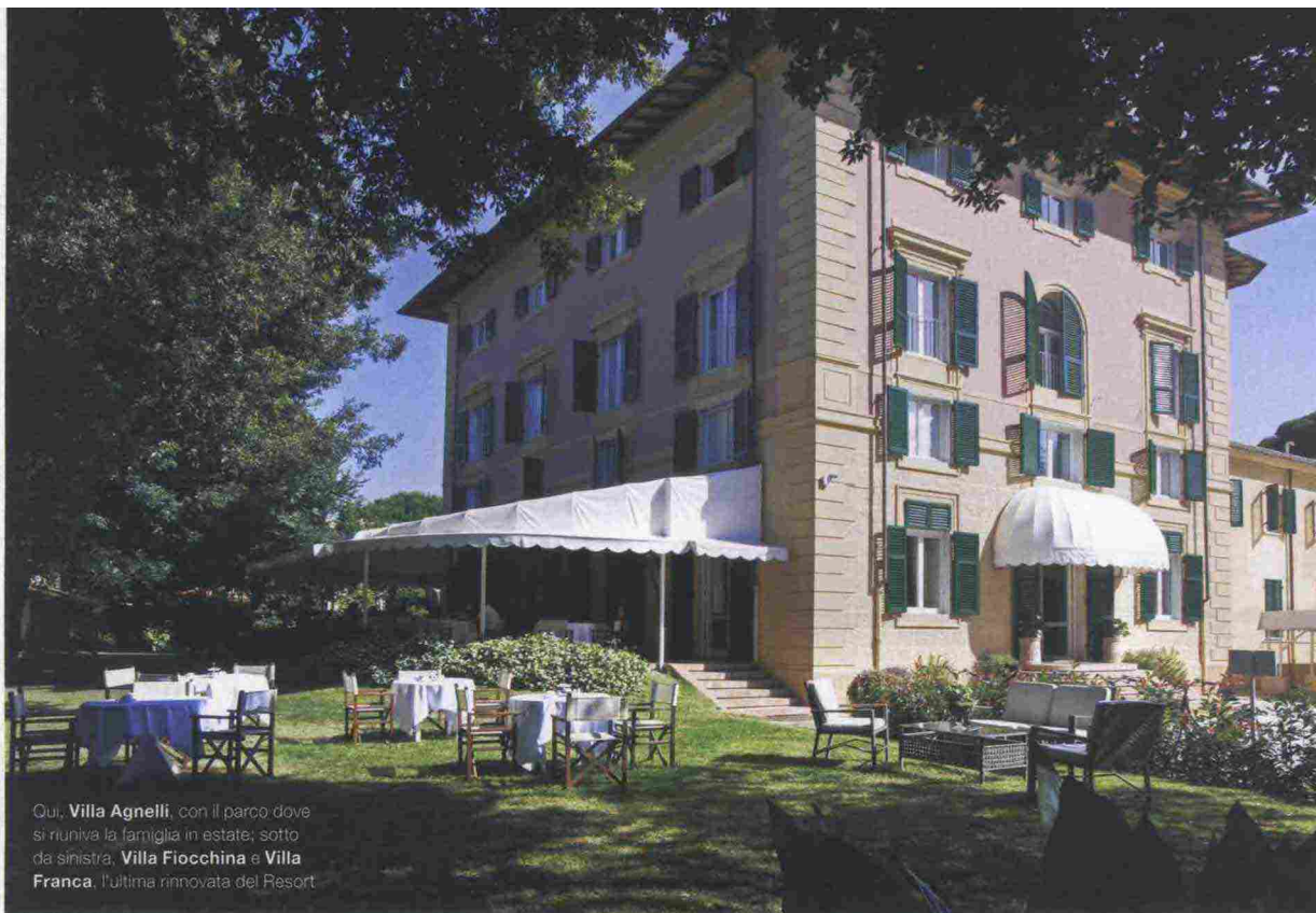
Qui, Villa Agnelli , con il parco dove si riuniva la famiglia in estate; sotto da sinistra, Villa Fiocchina e Villa Franca , l'ultima rinnovata del Resort

questo impagabile charme. Hendrix, Heston, Fallaci, Montale, Messina, Monicelli, Anka, Gassmann e la stessa famiglia Agnelli . Strepitoso il nuovo Fitness Center dotato di macchinari Technogym, mentre per i "gourmet victims", il ristorante La Fontana e La Sirena è pronto a coccolare il più esigente dei palati. Questo esclusivo Resort è l'ideale per trascorrere un soggiorno all'insegna della quiete nella più esclusiva località della riviera toscana, in mezzo alle gallerie d'arte di Pietrasanta , agli spettacoli ed eventi della dannunziana villa La Versiliana , alle suggestive visite dentro le cave di marmo di Carrara . Non