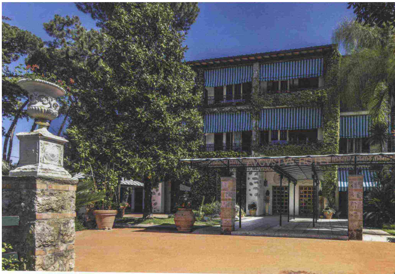
Nella pagina precedente, la welcome area del nuovo Augustus Beach Club ; sopra, Villa Pesenti , il primo nucleo del Resort; sotto, gli interni della struttura, dove prevalgono legno e toni pastello e una camera della villa

passaggio che dal giardino arrivava direttamente alla spiaggia privata, ora dell'Augustus. Si vedono ancora tracce dell'opera del grande paesaggista fiorentino Pietro Porcinai , eccellenza ancora difficilmente superata di architettura del verde. Fluisce intatta l'atmosfera degli anni '60 e sembra quasi di vedere la celebre famiglia di industriali prepararsi dopo il mare per un aperitivo in Capannina o una serata alla Bussole . Andando indietro nel tempo, addirittura sentire sulla pelle la salsedine del romanzo Vestivamo alla marinara . Grande attenzione anche per i più piccoli con uno spazio pluricreativo sempre aperto, riservato nelle ore pomeridiane alla loro creatività in modo da lasciar godere la siesta ai genitori. Ville di charme indipendenti con grande attenzione per la privacy, giardini privati, zona relax e Spa emozionante... Villa Pesenti è il corpo centrale intorno al quale gravitano i satelliti delle suites di sette villini eclettici progettati ed arredati dal famoso architetto Oswaldo Borsani , un pezzo di storia, l'eccellenza dell'italian design con il quale Lucio Fontana strinse un proficuo sodalizio. Pezzi simili sono stati venduti ultimamente alle migliori aste internazionali battendo cifre da capogiro! Personalità del cinema, dell'arte, della cultura, del jet set giunte da ogni parte del mondo si sono nutrite di