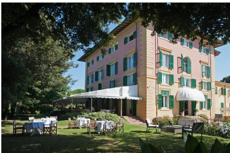
📍 Villa Agnelli

Il mare d'inverno è un lusso che solo in pochi possono sognare. Ma se siete nostalgici della bella stagione, Forte dei Marmi, e per la precisione l' Augustus Hotel & Resort , è proprio il posto che fa per voi. La storica Villa Agnelli (oggi Augustus Lido), rimarrà infatti aperta fino al 6 gennaio prossimo in un'inedita versione invernale.