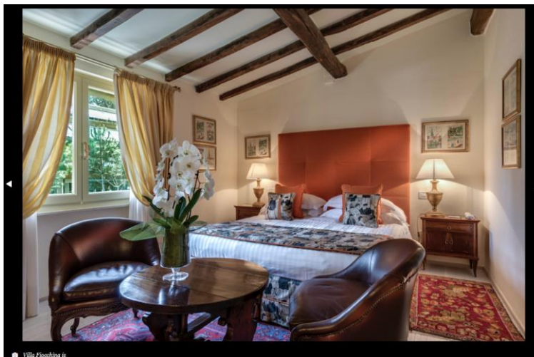
Villa Fieschina jr