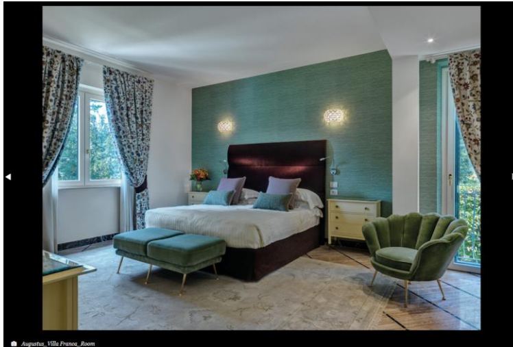
Augustus, Villa Pirena, Room

https://forbes.it/2019/08/29/allinterno-di-quella-che-fu-la-residenza-degli-agnelli-a-forte-dei-marmi/