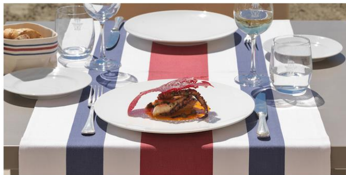
Augustus Hotel Forte dei Marmi

La striscia ininterrotta di spiaggia di oltre 30 chilometri che disegna la Versilia potrà essere vissuta in modo esclusivo e slow: pranzare sotto la veranda gustando pesce appena pescato, prendere un thè o un aperitivo al tramonto con splendida vista mare in compagnia di una buona lettura e godere del paesaggio sono solo alcune delle attività in cui gli ospiti dell' Augustus Hotel & Resort possono intrattenersi.