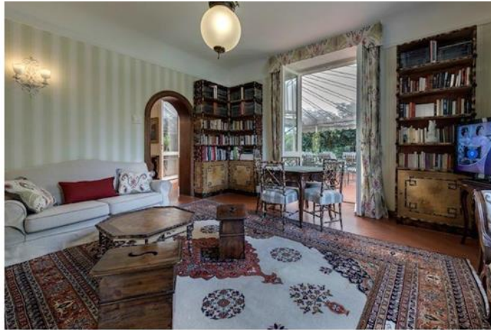
Augustus Hotel Forte dei Marmi

Il Bambaissa , il ristorante del Lido, propone costantemente una cucina creativa di pesce, rivisitando i piatti della tradizione italiana con accostamenti insoliti di sapori. Durante le festività, accoglierà gli ospiti dell'Augustus Hotel & Resort per festeggiare il Natale e il Capodanno.