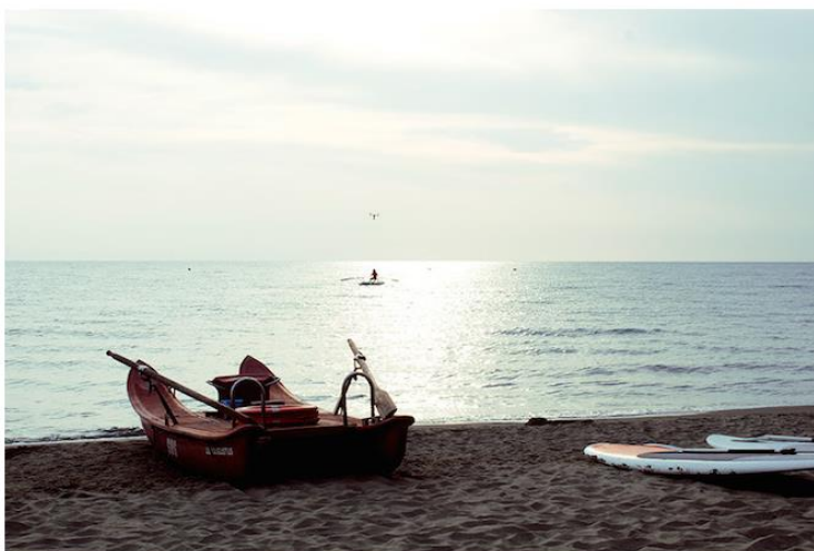
Augustus Hotel Forte dei Marmi – Photo Credit: Augustus Hotel & Resort

L' Augustus Hotel & Resort da quest'anno offre la possibilità di trascorrere Natale e Capodanno godendo dell'emozionante esperienza del mare d'inverno tra la pineta di Roma Imperiale e la spiaggia fortemarmina. Anche l' Augustus Lido dell'Hotel rimarrà aperto fino al 6 gennaio in una inattesa versione invernale.