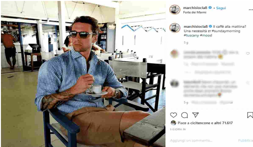
Claudio Marchisio a Forte dei Marmi

Forte dei Marmi è un'ambita meta per un soggiorno "sole e mare" ma regala anche sculture e monumenti storici da non perdere come, ad esempio, il Monumento ai lavoratori del mare , alto cinque metri, la centrale Piazza Garibaldi dove spiccano il Fortino che dà il nome alla città, la fontana con pozzo, e l'opera " La Vittoria " di Arturo Dazzi, e l'ottocentesca Chiesa di Sant'Ermete .