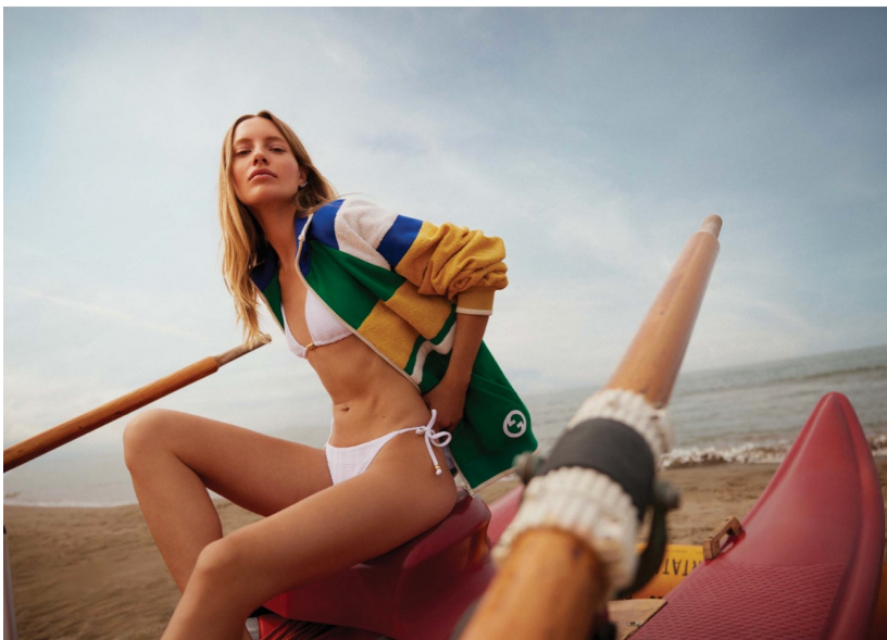
Bikini Calzedonia Camicia Beach