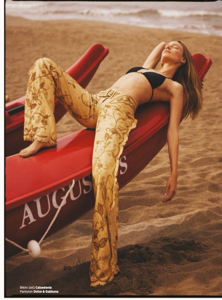
Bikini: Jilji Calzaretto Parfüm: Dolce & Gabbana