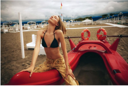
Bikini Calzedonia Pantolon Dolce & Gabbana