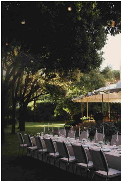
Il giardino di Villa Agnelli

Al posto delle "anelle gettate nell'acqua bollente" che "diventavano la migliore salsa per gli spaghetti" quando Susanna era bambina, oggi ci sono la riciclata con mandorle, mandorle aromatizzate e salsa al limone. Il frutto riserva San Massimo mantecato con frutti di mare, umami di pomodoro e salsa di ostriche e il dessert "Ciliegia e via bruci" piatti che trovano la loro cornice centrale nella collezione Caterie di Pinella per Pinella , con i famosi anelli rettangolari bordati d'oro e legati l'uno all'altro, a creare lunghi bordi dei piatti di porcellana.