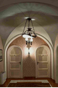
L'interno di Villa Agnelli oggi

Nel frattempo, nel 1939, Augusta Poveri aveva commissionato a Giulio Bazzani , una residenza sobria e razionalista, probabilmente in risposta alla vittoria dell'edificante dimora degli Agnelli. Un rigore compensato dai materiali e dalle finiture, come le lastre di marmo verticali che, come un moderno porticato, separano le due zone del soggiorno o il motivo dice degli arredi o i tessuti coordinati con cui erano rivestite le poltrone, i sopraluoghi e i tendaggi.