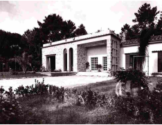
Villa Poveri prima della costruzione del secondo piano dell'Augusta Hotel & Resort

Nel frattempo, nel 1939, Augusta Poveri aveva commissionato a Giulio Bazzani , una residenza sobria e razionalista, probabilmente in risposta alla vittoria dell'edificante dimora degli Agnelli. Un rigore compensato dai materiali e dalle finiture, come le lastre di marmo verticali che, come un moderno porticato, separano le due zone del soggiorno o il motivo dice degli arredi o i tessuti coordinati con cui erano rivestite le poltrone, i sopraluoghi e i tendaggi.