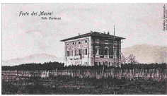
Villa Costanza in una cartolina d'epoca