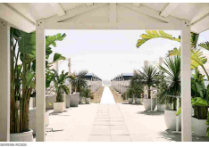
Augusta Beach Club