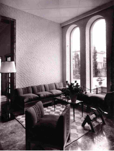
L'interno di Villa Poveri